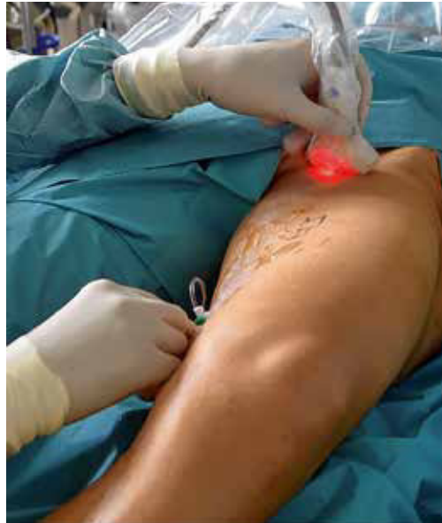
Minimal-invasive Lasercrossektomie unter Ultraschallkontrolle

men erreicht. Derzeit ist die Kombination von Lasern mit wasserabsorbierenden Laserwellenlängen und radial abstrahlenden Fasern der Goldstandard. Über 90 % der Patienten haben keine oder nur minimale Schmerzen nach der Ablation, so dass Schmerzmittel nach dem Eingriff in der Regel nicht erforderlich sind. Unmittelbar nach dem Lasereingriff können die Patienten z. T. schon nach 30 Minuten die Klinik verlassen, ein stationärer Aufenthalt ist in der Regel nicht erforderlich. Thermische Ablationen werden in Tumescenz-Lokalanästhesie durchgeführt.