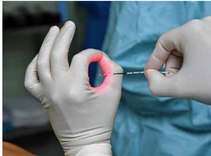
Doppelt radial abstrahlende Laserfaser

Jede 5. Frau und jeder 6. Mann hat eine behandlungsbedürftige Venenerkrankung. Krampfadern werden in der Medizin als Varizen bezeichnet; Krampfaderleiden als „Varikose“ oder „Varikosis“. Rechtzeitig behandelt, können Komplikationen verhindert werden. Für jeden Patienten wird individuell ein Therapiekonzept erstellt. Meist werden mehrere Behandlungsmethoden wie die Kompressionstherapie, Verödungsbehandlung, endoluminal thermisch ablativ Verfahren bis hin zur minimal-invasiven offenen chirurgischen Therapie kombiniert.