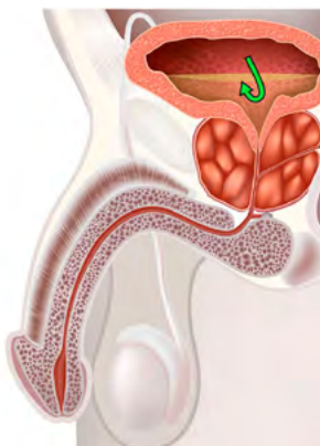
Vergrößerte Prostata (BPH)

Bei der digitalen-transrektalen Untersuchung (DRU) ertastet der Urologe die Größe der Prostata durch den Anus mit dem Finger. Mit transrektalem Ultraschall (TRUS) wird die Prostata bildlich dargestellt und gleichzeitig berechnet ein Computer ihr Volumen. Hinzu kommen die Untersuchung des Urins und die Bestimmung des PSA-Wertes - das ist ein Blutwert, mit dem man ein Prostatakarzinom feststellen kann.