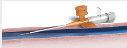
Platzierung des 14GA-Katheter

einem gewöhnlichen 5Fr-Introducer-Set (anstelle von 6Fr) erfolgen. Passen Sie sich in Bezug auf Energie, Leistung und Vorgehensweise flexibel an die jeweilige Vene an.